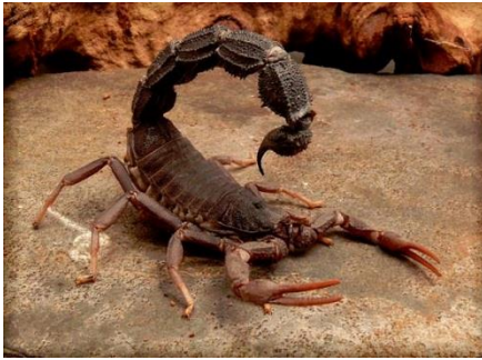
1. Kalajengking Afrika Utara