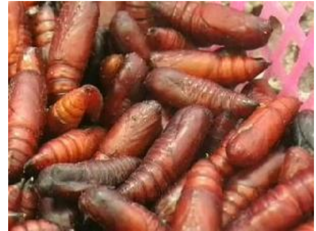
Kepompong Ulat Jati