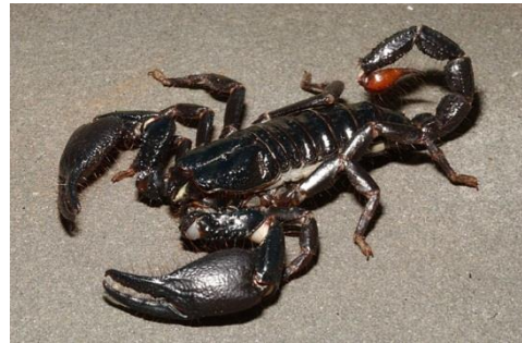
2. Kalajengking Asia