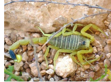
3. Kalajengking Afrika