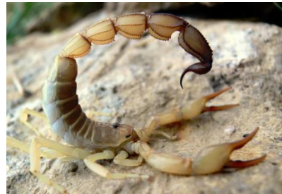
5. Kalajengking Gurun