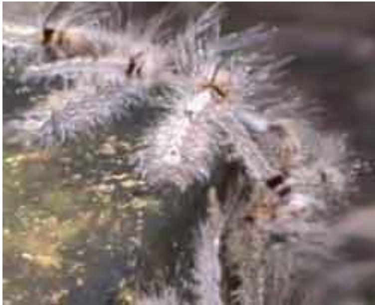
Ulat bulu NGENGAT