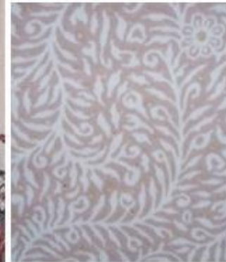
ZOOM bagian kain yang berwarna krem