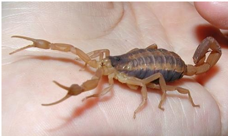
4. Kalajengking Amerika