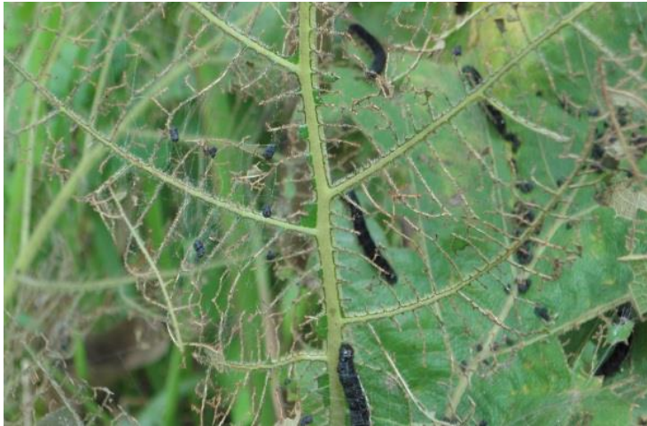
Ulat pada daun jati : Hyblaea puera