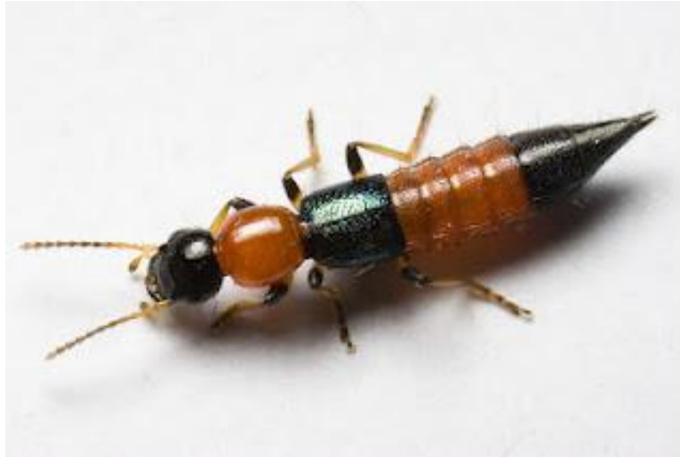
Paederus sp , kumbang tomcat